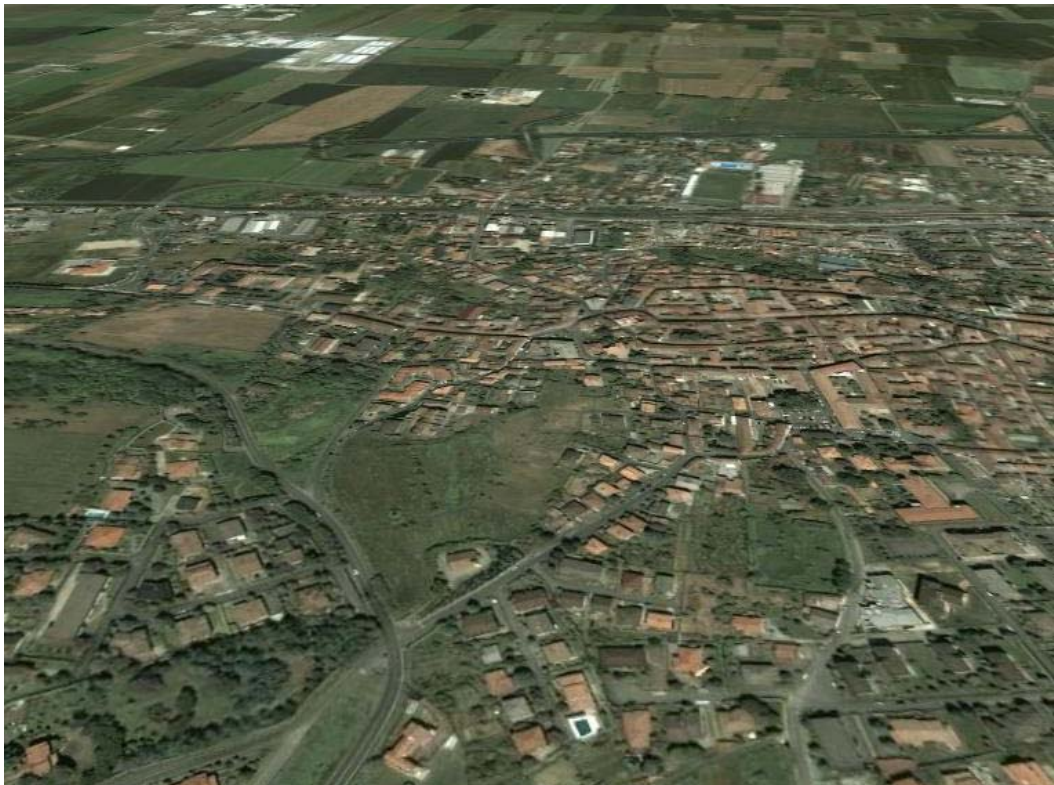
La “goccia verde” appena a sud dell’abitato con la basilica in basso a destra

Nel senso che le cose succedono, identiche, anche da noi, e tra l'altro fanno molti più danni perché lo sviluppo della città diffusa (poco città ma molto diffusa) qui avviene sovrapponendosi a tessuti storici molto più delicati. Ma mentre succedono, le cose, non se ne accorge nessuno, e anche quando se ne accorge gli rispondono sempre “ma dai!”. Una pacca sulla spalla e via. Salvo poi, quando i danni sono fatti, aggiungere “ma noi non potevamo sapere”.